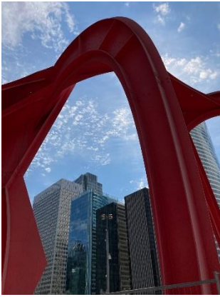
Rendez-vous au pied de la sculpture de Calder